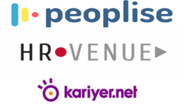
İnsan Kaynakları Platformları